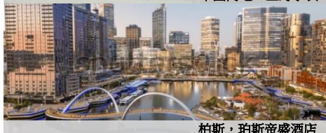
柏斯，珀斯帝盛酒店