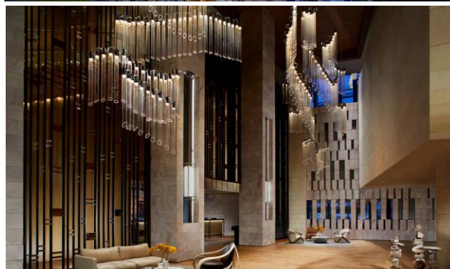
出售珀斯麗思卡爾頓酒店50%股權，資產估值達2億8千萬澳元