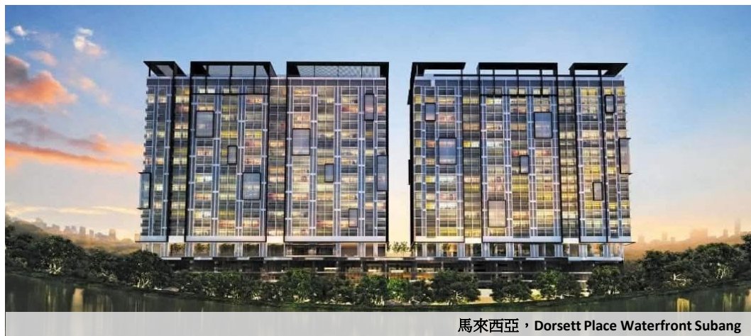
馬來西亞，Dorsett Place Waterfront Subang