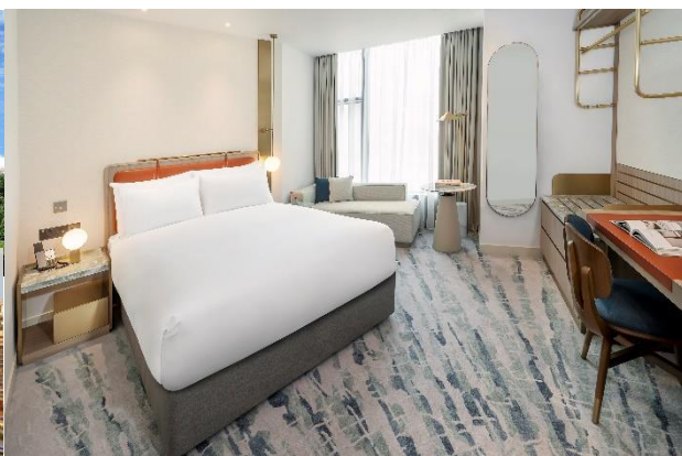
倫敦，Dorsett Canary Wharf London