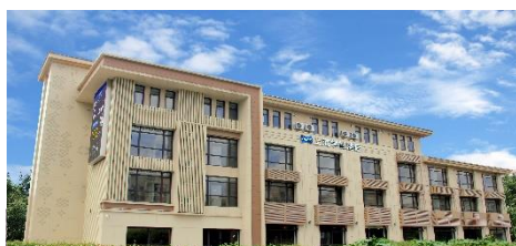
中國內地，上海學嶼

我們預計未來12個月開設澳洲之珀斯帝盛酒店。預計該新增項目將加強我們之經常性收入組合，並支持收益及盈利能力之長期增長。