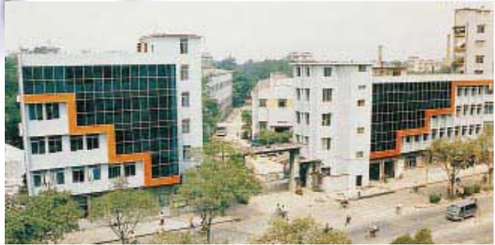
Guangzhou Pegasus Boiler Factory, Guangzhou 廣州勁馬鍋爐廠