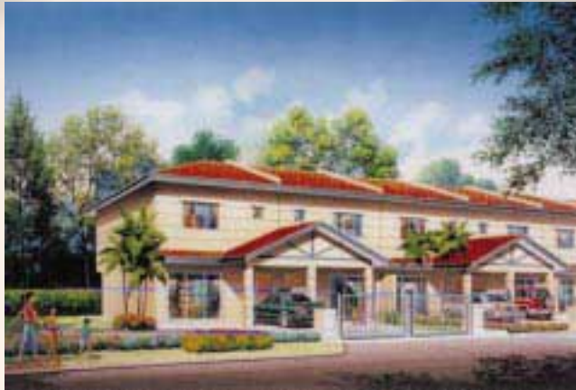
Proposed Taman Teluk Bedong Indah Development 公寓