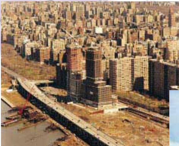
Residential Development Project at Riverside South Manhattan, New York, U.S.A. 美國紐約曼克頓區之住宅發展項目