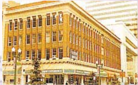
Kelly Ramsey Building, Edmonton, Canada 加拿大愛民頓市之商業大廈