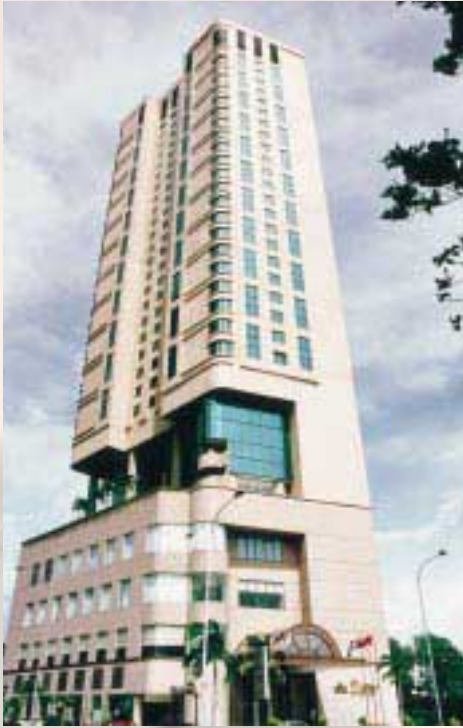
Dorsett Regency Hotel, Kuala Lumpur 吉隆坡之酒店