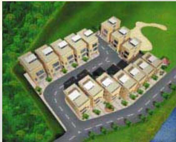
Low-density Houses Development at Pak Shek Wo, Sai Kung 低密度住宅發展於西貢白石窩