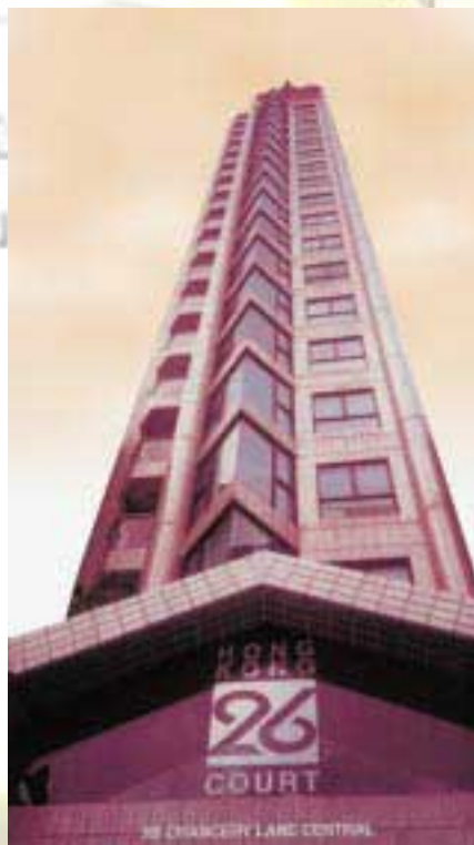
Hong Kong 26 Court