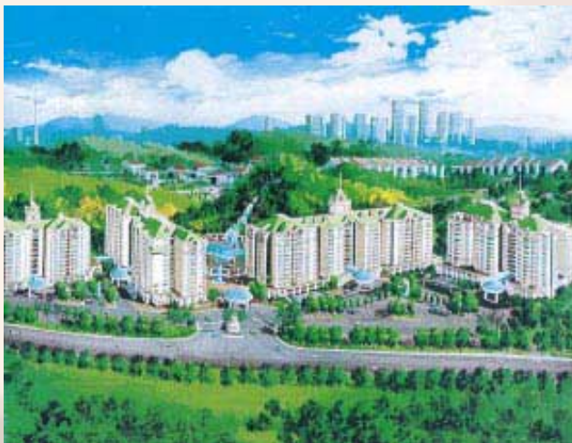
Regina Court Condominium 公寓