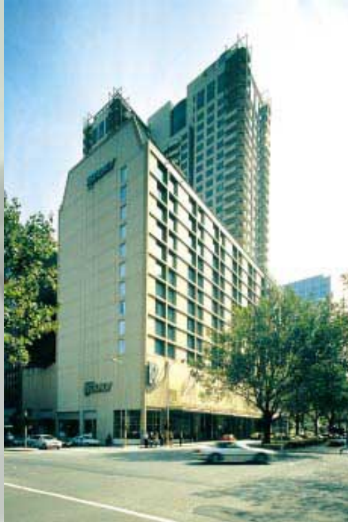
Rockman's Regency Hotel & Tower, Melbourne 墨爾本之酒店及公寓