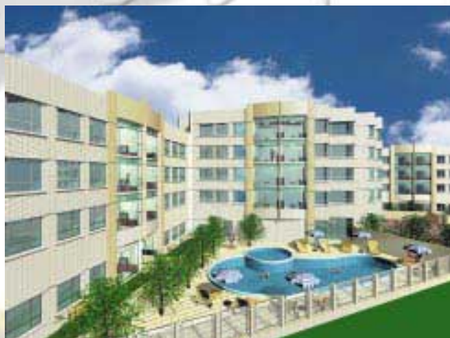
Low-density Residential Development at Tan Kwai Tsuen, Yuen Long 低密度住宅發展於元朗丹桂村