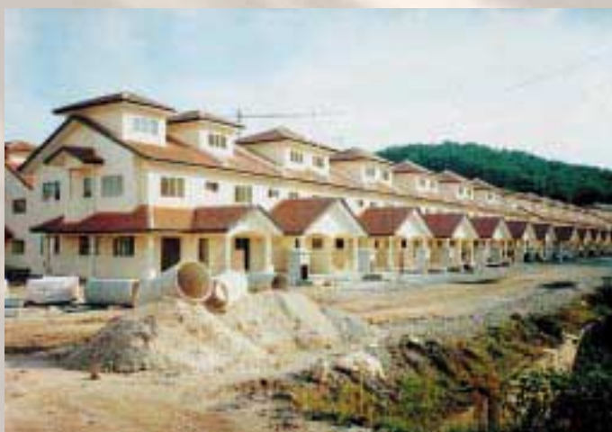
Desa Karunmas 2 1/2 Storey Terrace House 住宅