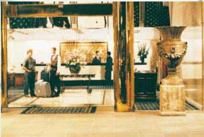
Rockman's Regency Hotel Lobby 酒店大堂