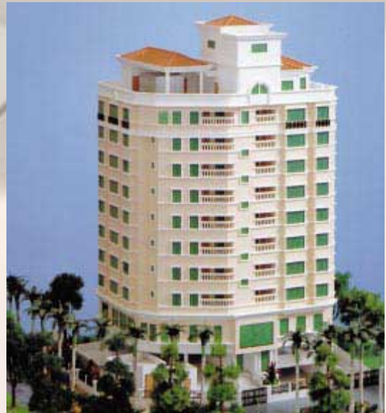
Sri Jati Condominium 公寓