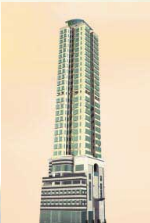
Composite Development at Baker Street, Hunghom 綜合發展大廈於紅磡必嘉街