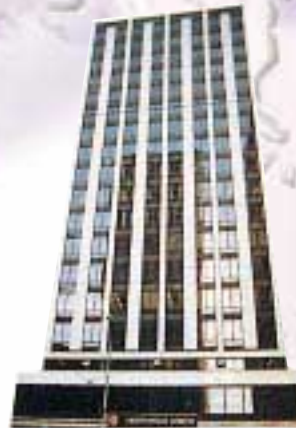
Cambridge Building, Edmonton, Canada 加拿大愛民頓市之商業大廈