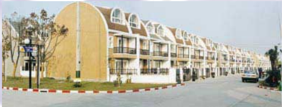
California Gardens, Shanghai (New China Homes, Ltd) 上海錦秋加州花園