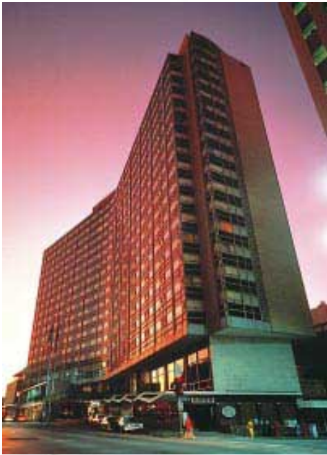
Dallas Grand Hotel, Dallas, Texas, U.S.A. 美國德薩斯市之達拉斯大酒店