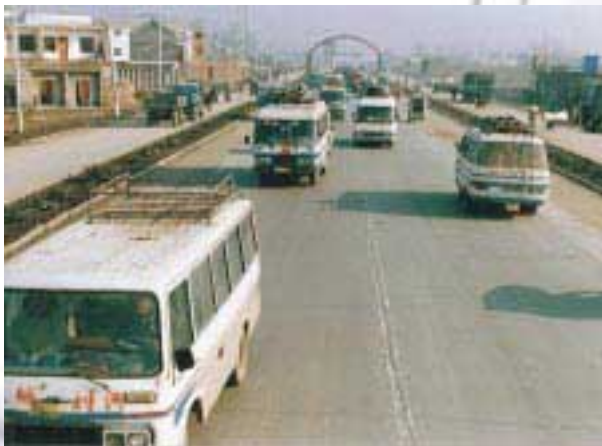
National Highway 311 (Henan Province Yong Cheng City) 國道311 (河南省永城市)