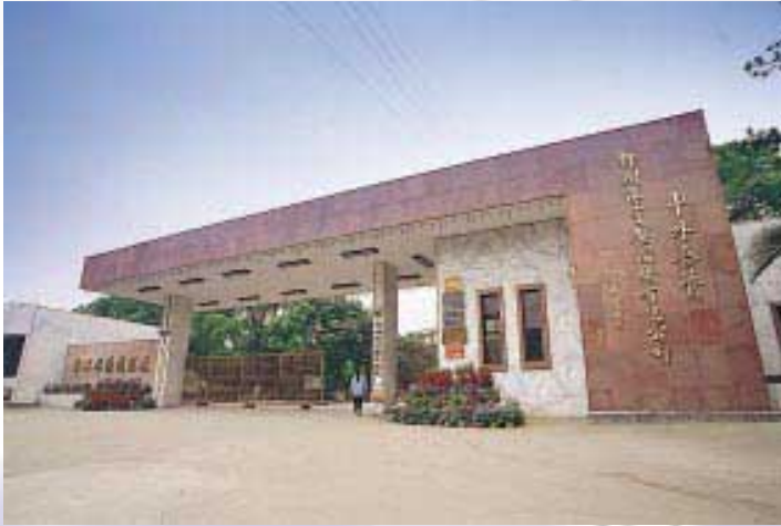
Liuzhou Universal Compressor Factory 柳州環宇壓縮機廠