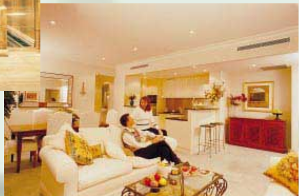
Rockman's Regency Tower Apartment Interior 公寓之室內設計