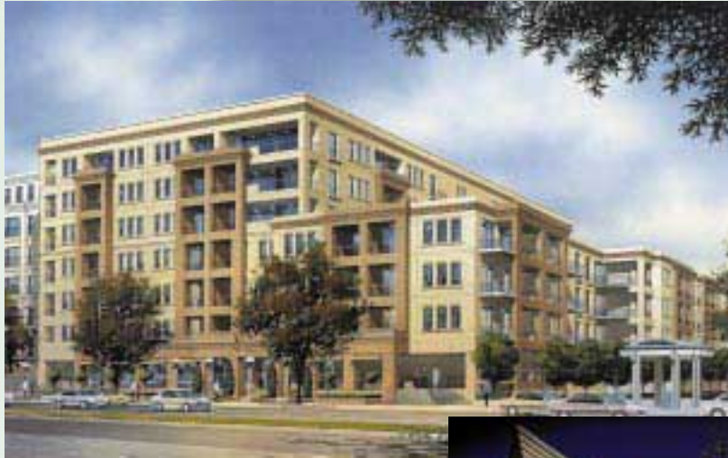
360 St. Kilda Road, Melbourne “Royal Domain Plaza Apartments” 墨爾本之公寓