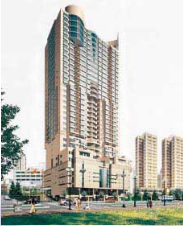
New Time Plaza, Guangzhou 廣州之新時代廣場