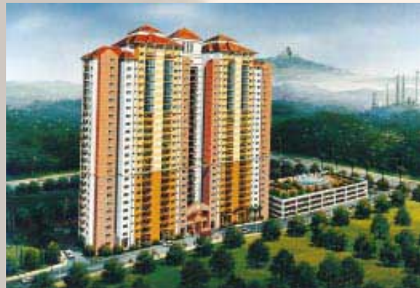
Proposed Apartments in Segambut (Planning Stage) 公寓