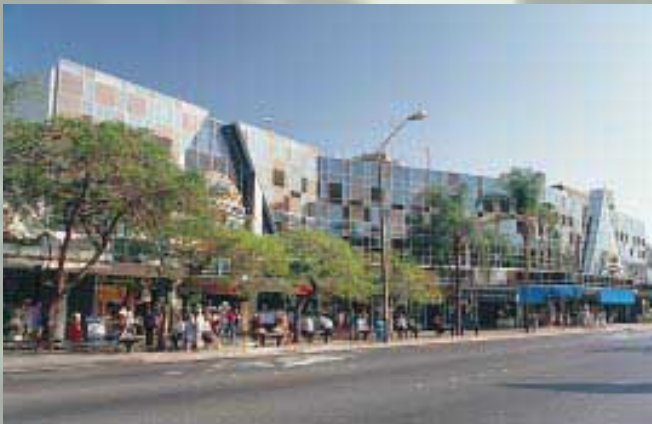
Dolphin Arcade, Surfers Paradise 滑浪者天堂之商場